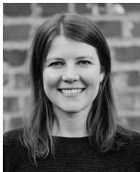
e Stiftung Umwelt und Entwicklung NRW