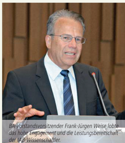
BA-Vorstandsvorsitzender Frank-Jürgen Weise lobte das hohe Engagement und die Leistungsbereitschaft der IAB-Wissenschaftler.

Die repräsentative Arbeitgeberbefragung gibt es seit 1993 in Westdeutschland und seit 1996 auch in Ostdeutschland. Für diese größte Betriebsbefragung in Deutschland werden mittlerweile jedes Jahr persönlich-mündliche Interviews in fast 16.000 Unternehmen geführt. Die erhobenen Daten werden über das Forschungsdatenzentrum der BA im IAB Wissenschaftlern aus dem In- und Ausland zugänglich gemacht.