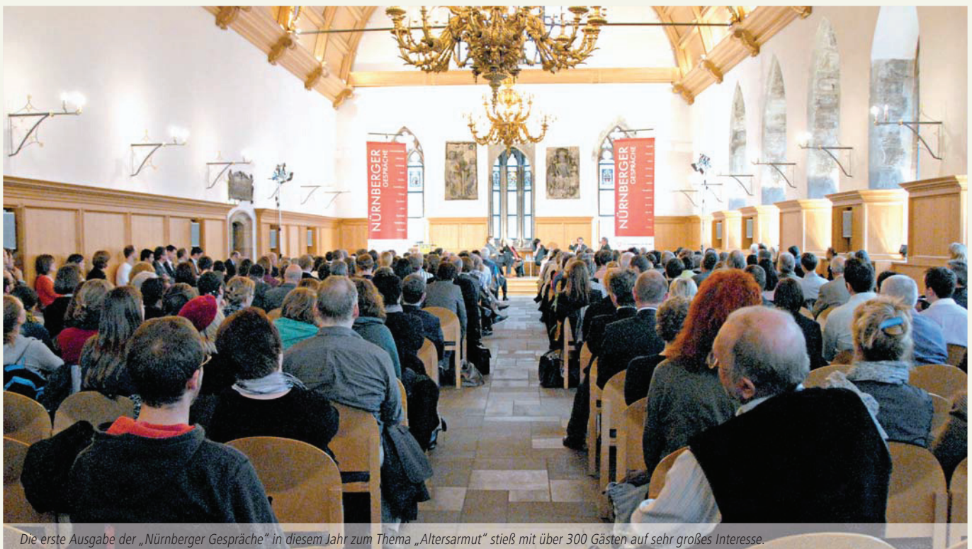
Die erste Ausgabe der „Nürnberger Gespräche“ in diesem Jahr zum Thema „Altersarmut“ stieß mit über 300 Gästen auf sehr großes Interesse.

Energisch sprach sich der SPD-Bundestagsabgeordnete und ehemalige Bundesarbeitsminister dafür aus, endlich einen flächendeckenden gesetzlichen Mindestlohn einzuführen. Börsch-Supan äußerte Bedenken an einem allgemeingültigen Mindestlohn, da dieser zum Beispiel im Friseurgewerbe Arbeitsplätze vernichten könnte. Er zeigte sich davon überzeugt, dass Mindestlöhne keinen Schutz