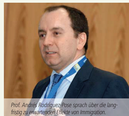
Prof. Andrés Rodríguez-Pose sprach über die langfristig zu erwartenden Effekte von Immigration.

Bei der Konferenz, die am 6. und 7. Dezember 2012 in Nürnberg stattfand, analysierten die Referenten die Folgen der Diversifikation im Hinblick auf die Dimensionen Beruf, Bildung, Alter, Geschlecht, Nationalität und kulturellem Hintergrund der Beschäftigten. Die daraus resultierenden Forschungsfragen wurden aus der