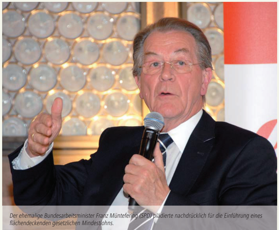
Der ehemalige Bundesarbeitsminister Franz Müntefering (SPD) plädierte nachdrücklich für die Einführung eines flächendeckenden gesetzlichen Mindestlohns.

Aktuellen Umfragen zufolge sieht sich jeder dritte Arbeitnehmer von Altersarmut bedroht. Berechtigte Furcht oder „German Angst“? Ist die Rente noch sicher, wie einst von Bundesarbeitsminister Norbert Blüm behauptet? Sind die prekär Beschäftigten von heute die Armutsrentner von morgen? Rutschen künftig gar Durchschnittsverdiener in die Grundsicherung im Alter? Und welche Reformen brauchen wir am Arbeitsmarkt, um spätere Altersarmut zu vermeiden? Um diese und weitere Fragen ging es am 29. April 2013