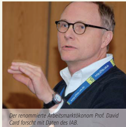
Der renommierte Arbeitsmarktökonom Prof. David Card forscht mit Daten des IAB.

Nachdem das Forschungsdatenzentrum der BA im IAB eine Außenstelle in Ann Arbor eingerichtet hat, nutzen immer mehr nordamerikanische Wissenschaftler die Daten der Bundesagentur für Arbeit und des IAB für ihre Forschung. Beim ersten „Workshop on the Analysis of Administrative Data“ tauschten deutsche und amerikanische Wissenschaftlerinnen und Wissenschaftler in Nürnberg Ergebnisse und Erfahrungen aus.