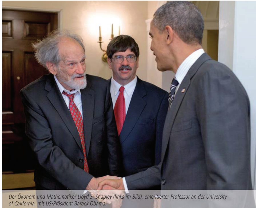
Der Ökonom und Mathematiker Lloyd S. Shapley (links im Bild), emeritierter Professor an der University of California, mit US-Präsident Barack Obama.

Der Algorithmus setzt voraus, dass die Suchenden über die jeweils andere Marktseite informiert sind, entsprechende Präferenzen für die Anbieter auf der anderen Marktseite bilden und diese in einem individuellen Ranking ordnen.