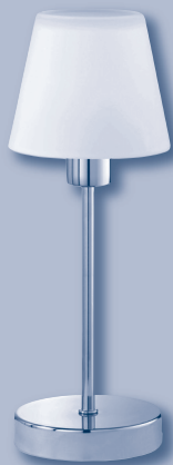
Tischleuchte mit Touchdimmer