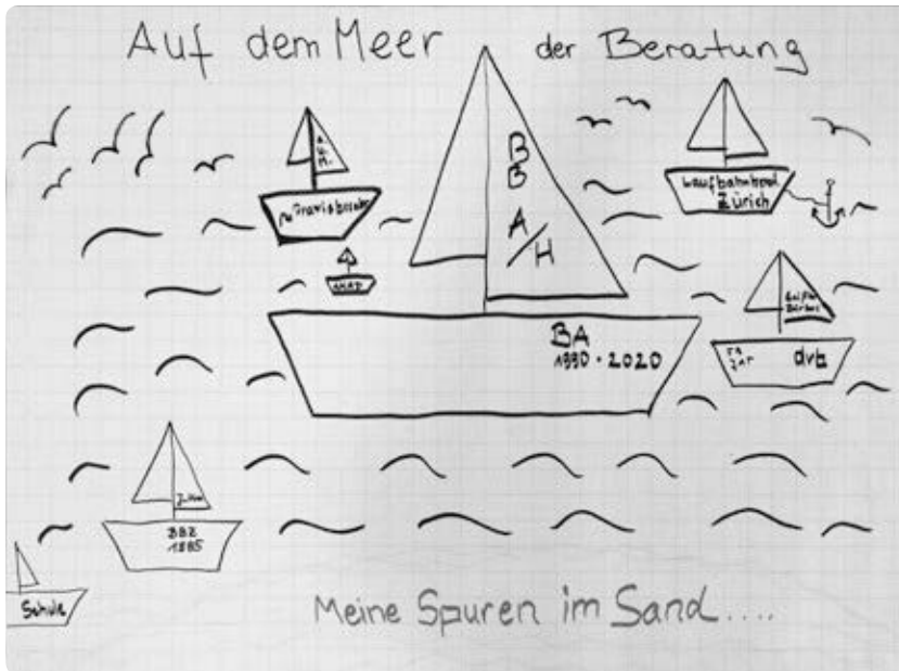
Abb. 2: Individuelle Wege ins Feld der Beratung

shop und seine Ergebnisse als auch eine zusammenfassende Erläuterung und Diskussion von empirischen Daten zum Feld der Beratung, welche der Autor 2016 im Rahmen seiner Dissertation erhoben hat.