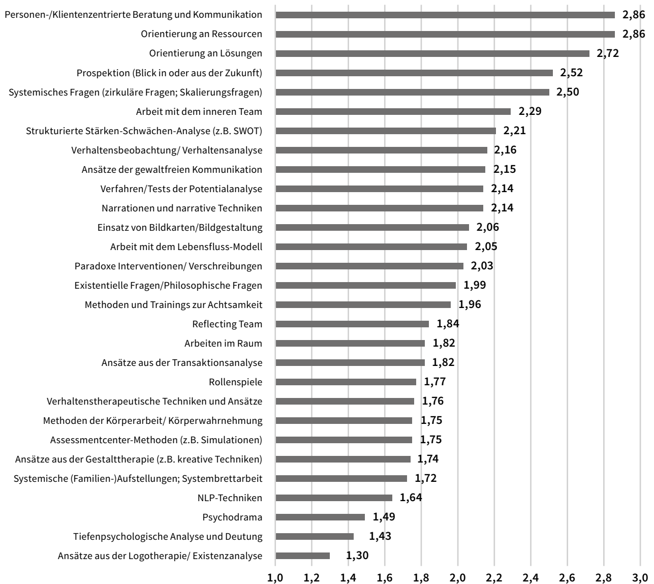
Abb. 3: Einschätzung des praktischen Nutzens der verwendeten Beratungsmethoden (eigene Darstellung)

1: niedrig, 2: mittel, 3: hoch; N= 147-239