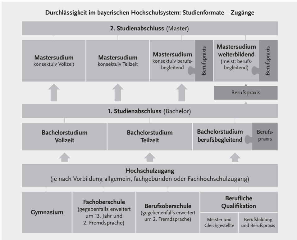
Abb. 1: Durchlässigkeit im bayerischen Hochschulsystem