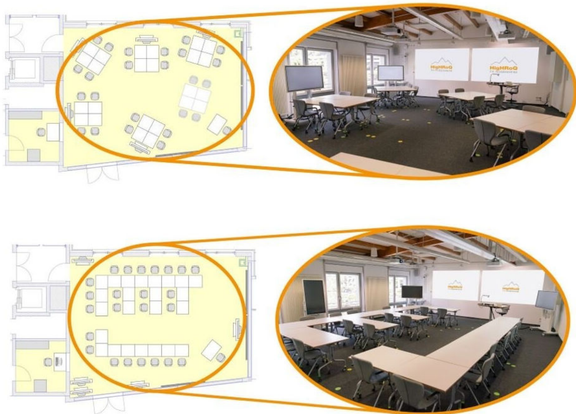
Abbildung 1: Häufig genutzte Möbelszenarien im Future Skills Lab

Das Future Skills Lab ist mit seiner Fläche für 24 vor Ort anwesende Studierende ausgelegt und ermöglicht darüber hinaus die Zuschaltung weiterer Teilnehmender über digitale Kanäle. Die Möblierung ist hochgradig modular: Rollbare Tische und Stühle bieten zahlreiche Kombinationsmöglichkeiten, die durch visuelle Orientierungshilfen in Form von Bodenmarkierungen unterstützt werden. Diese erleichtern das schnelle Umstellen der Raumstruktur und fördern eine flexible Nutzung – sei es in Form von Gruppentischen, L-Form-Anordnungen, Halbkreisen oder Frontalunterricht. Die Offenheit des Raumdesigns ermöglicht sowohl konzentriertes Einzelarbeiten als auch lebendige Gruppendiskussionen und informelle Begegnungen.