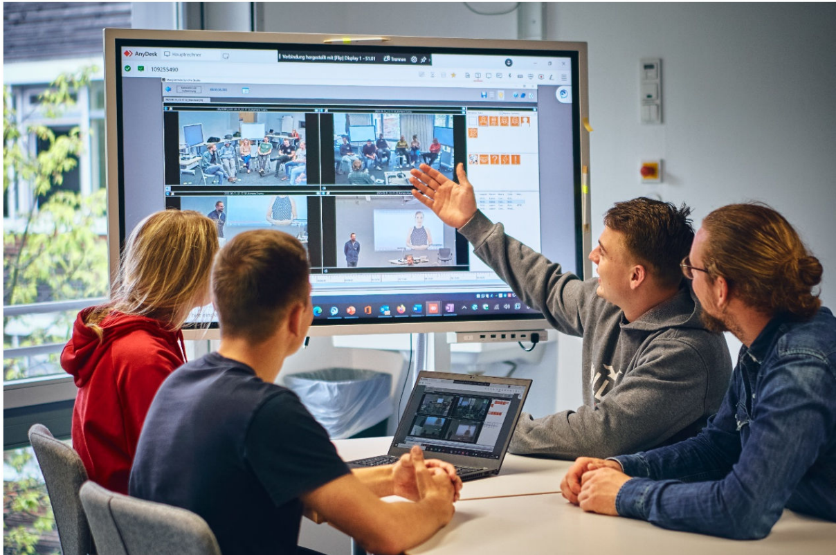
Abbildung 3: Videografie und Analyse im Future Skills Lab