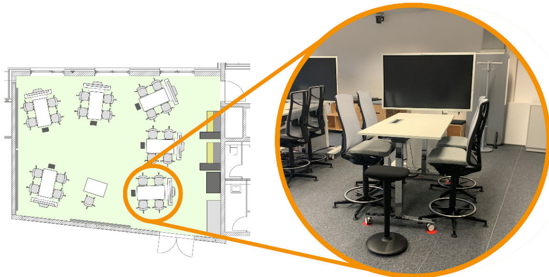
Abbildung 2: Möbelszenario im Labor für hybride Gruppenarbeiten

und technischen Geräte erlauben sollten. Allerdings zeigte sich in der Praxis, dass die aufwendig integrierte Medientechnik und die damit verbundene Infrastruktur spontane Umgestaltungen erschweren. Daher ist die Möblierung aktuell eher starr, mit fest angeordneten Gruppentischen und Flipcharts, und auf interaktive, kollaborative Formate ausgelegt. Der Raum verzichtet auf eine klare Vorder- oder Rückseite, was die Kommunikation und Zusammenarbeit zwischen allen Teilnehmenden erleichtert und eine neue Rollenverteilung zwischen Lehrenden und Lernenden schafft.