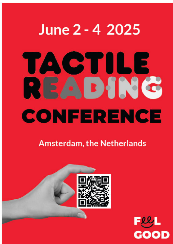
Abbildung 1: Poster der Tactile Reading Conference. (Beschreibung siehe Abbildungs- und Tabellenverzeichnis mit Alternativtexten)