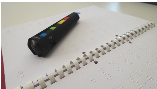
Abbildung 2: PennyTalks-Hörstift auf einer Seite der in Punktschrift übertragenen Fibel (Beschreibung siehe Abbildungs- und Tabellenverzeichnis mit Alternativtexten)