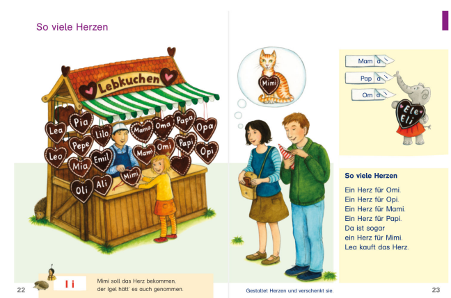
Abbildung 1: Seiten 22–23 aus „Die Auer Fibel – Mein Erstlesebuch“ (Beschreibung siehe Abbildungs- und Tabellenverzeichnis mit Alternativtexten)

Die Erstlesefibel „Die Auer Fibel – Mein Lesebuch“ erschien 2014 im Ernst Klett Verlag Stuttgart. Auf insgesamt 139 Seiten werden nacheinander alle Buchstaben des Alphabets sowie Lautgruppen eingeführt.