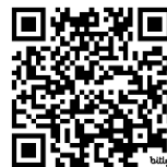
Abbildung 6: Seiten 2 und 3 der Fibel: https://bit.ly/3N71Ey0 (Beschreibung siehe Abbildungs- und Tabellenverzeichnis mit Alternativtexten)

Unter den folgenden URLs bzw. QR-Codes finden sich zwei Hörbeispiele: