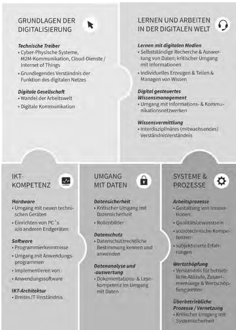
Abb. 1: Das Grundlagenmodell für digitale Kompetenzen (Röhrig/Michailowa 2018b)

Die Notwendigkeit, den Veränderungen der digitalen Transformation mit neuen Qualifizierungsansätzen zu begegnen, und der Wunsch, die Möglichkeiten der Digitalisierung aktiv nutzen zu können, waren Hintergründe für das Berliner Modellprojekt „Zusatzqualifikation für digitale Kompetenzen in der Aus- und Weiterbildung“, das wir 1 im Auftrag der