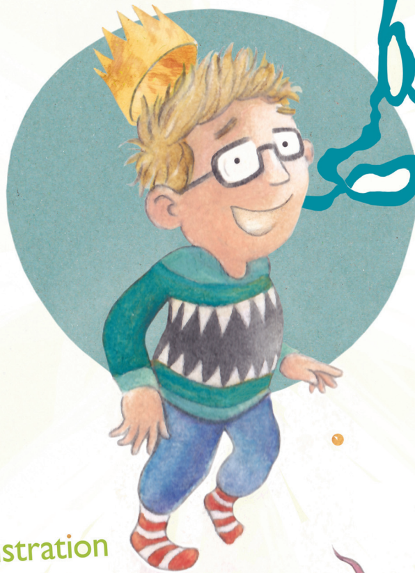
Illustration & Gestaltung von Börnd Lehmann