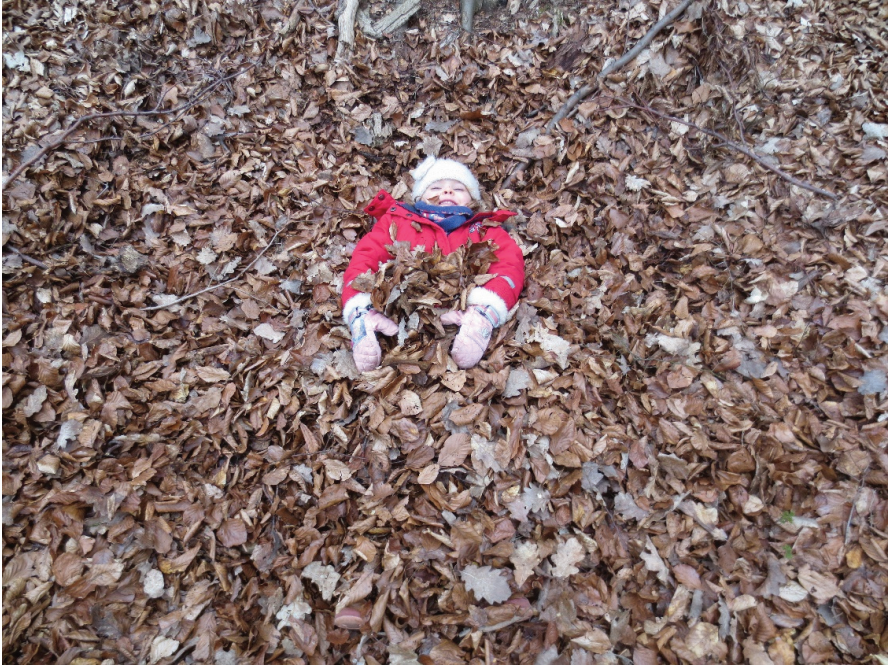
Der Mensch als Teil und Gegenüber der Natur