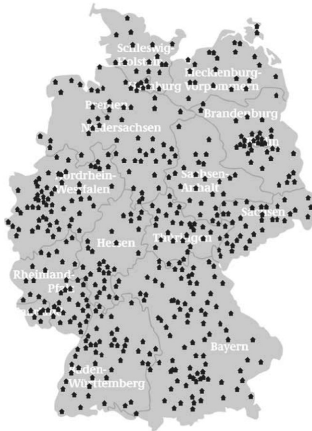
Abb. 1: Standorte der Mehrgenerationenhäuser in der Bundesrepublik Deutschland

tere 146 Einrichtungen nahmen ihre Arbeit als Mehrgenerationenhaus im Laufe des Jahres 2007 auf. In einer dritten Förderwelle wurden weitere 300 Häuser ausgewählt und im Laufe des Jahres 2008 Teil des Aktionsprogramms. Innerhalb dieser letzten Gruppe werden 200 Häuser aus Mitteln des Europäischen Sozialfonds (ESF) gefördert. Bei der Auswahl der zu fördernden Einrichtungen wurde auf ein Jurorenverfahren zurückgegriffen und für eine flächendeckende Präsenz des Aktionsprogramms in fast jedem Landkreis und jeder kreisfreien Stadt mindestens ein Mehrgenerationenhaus etabliert (siehe Abbildung 1).